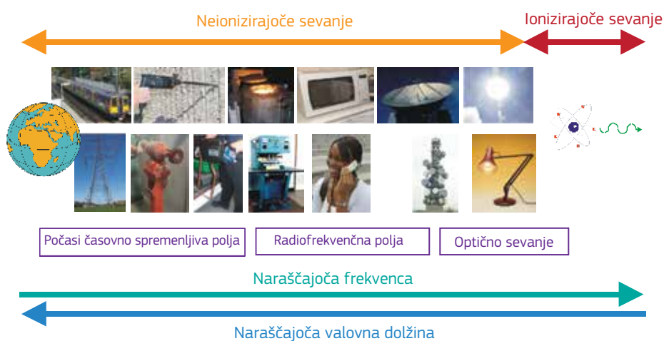
Slika 3.1 – Shematski prikaz elektromagnetnega spektra z nekaterimi tipičnimi viri

Namen tega priročnika je delodajalcem zagotoviti informacije o virih EMP, ki se lahko nahajajo v delovnem okolju, ter jim tako olajšati sprejemanje odločitev o tem, ali bodo potrebne nadaljnje ocene tveganja zaradi elektromagnetnih polj. Obseg in moč elektromagnetnih polj sta odvisna od napetosti, toka in frekvence, pri katerih oprema deluje oziroma ki jih ustvarja, ter od same zasnove opreme. Določena oprema je lahko zasnovana za namensko ustvarjanje zunanjih elektromagnetnih polj. V tem primeru lahko tudi majhne naprave z majhno močjo ustvarijo močna zunanja elektromagnetna polja. V splošnem je za opremo, ki deluje pri visokem toku ali napetosti ali ki je zasnovana za namensko oddajanje elektromagnetnega sevanja, treba opraviti nadaljnje ocene.