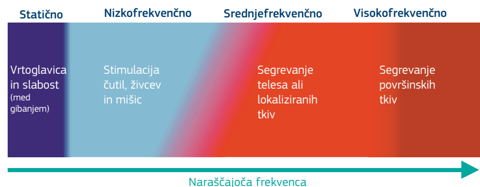
Slika 2.1 – Vplivi EMP v različnih frekvenčnih območjih (frekvenčni intervali niso prikazani v merilu)

Ti koncepti so grafično prikazani na sliki 2.1.